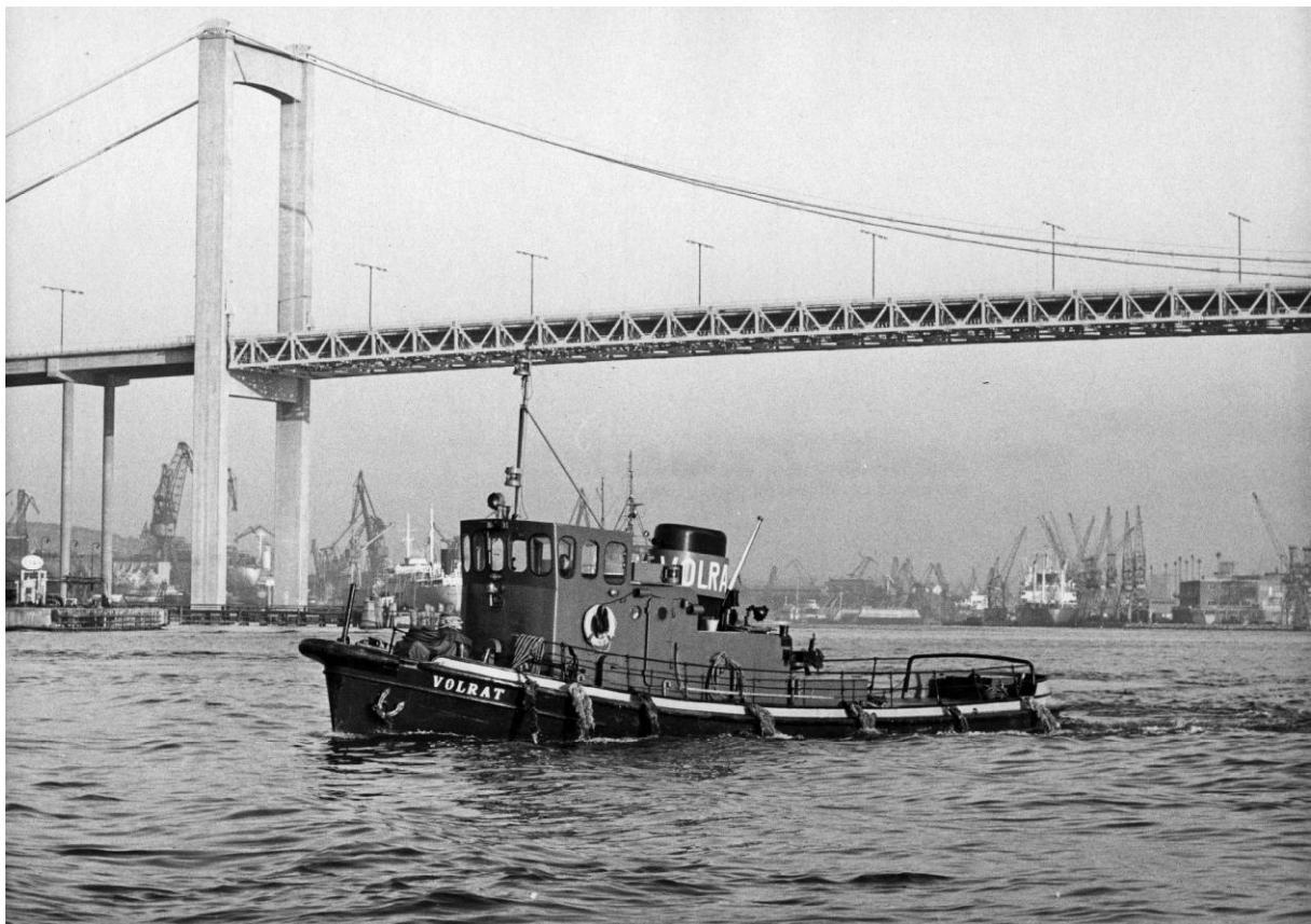
Volrat.