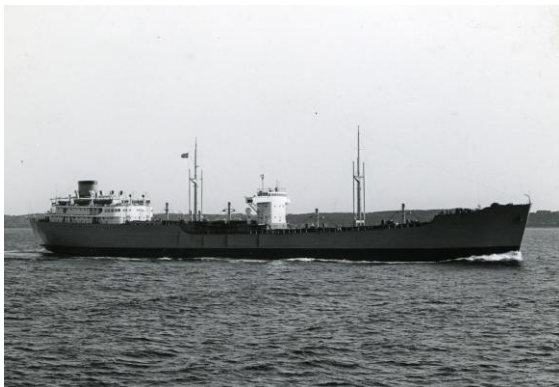
Pajala (2) 1951–1979.

Gränges hade då redan låtit bygga ytterligare en Pajala (3) på Götaverken Arendal år 1969. Det var åter en malmtanker men denna gång på hela 106 400 dwt. Hon såldes 1978 till Liberia och höggs upp i Kina 1993 under namnet Mosel Ore .