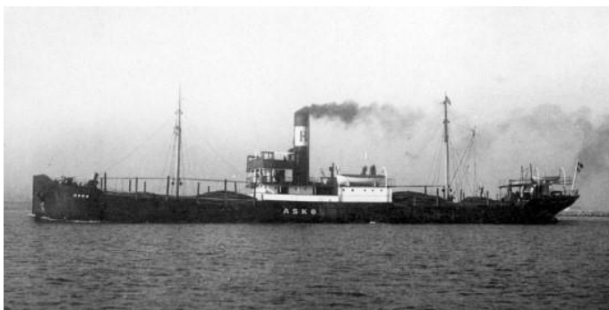
S/S Foxen som Askø.

Denna kväll passerade Ahlmarksångaren Foxen Pentland Sound, alltså väldigt nära Pajalas förlisningsplats, på resa från Garston vid Liverpool med kollast destinerat till Göteborg. Omkring klockan 20.45 på kvällen, cirka 85 nautiska mil från Pentland, inträffade en häftig explosion midskepps, då fartyget bröts i två delar och gick till botten. Det var den tyska ubåten U 57 som hade avlossat en torped mot Foxen . Hon var byggd 1920 som Patria i Stavanger med brutto 1 308, var så i dansk tjänst som Askø , men såldes senare till Ahlmarks rederi i Karlstad. Vid förlisningen kunde bara två jungmän ur besättningen räddas på var sin flotte.