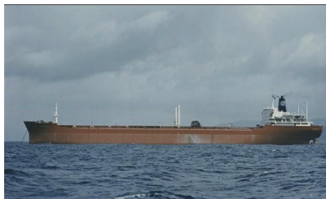
Pajala (3) 1969–1993.