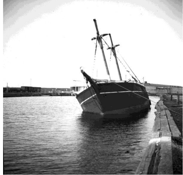
Gerda Baggarevarvet

För den som vill läsa mer om varvsverksamheten i Gävle rekommenderas en artikel i ämnet av Nils Sjökvist publicerad i Länspumpen nummer 3, 2022