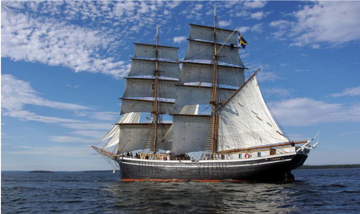
Gerda 2006-07-14