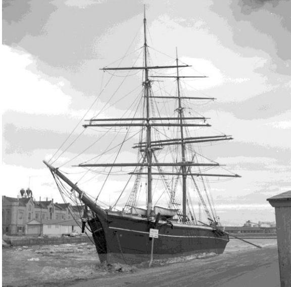
Gerda i Gävle 1949

I juni 1936 kom hon tillbaka till sin födelsestad för att bli ett flytande museum och lades centralt i Gävleån. Det saknades dock medel för underhåll och i brist på pengar förföll fartyget alltmer. Hösten 1950 var hon i så dåligt skick att man fick sluta med museiverksamheten. Hon sprängdes slutligen 1959.