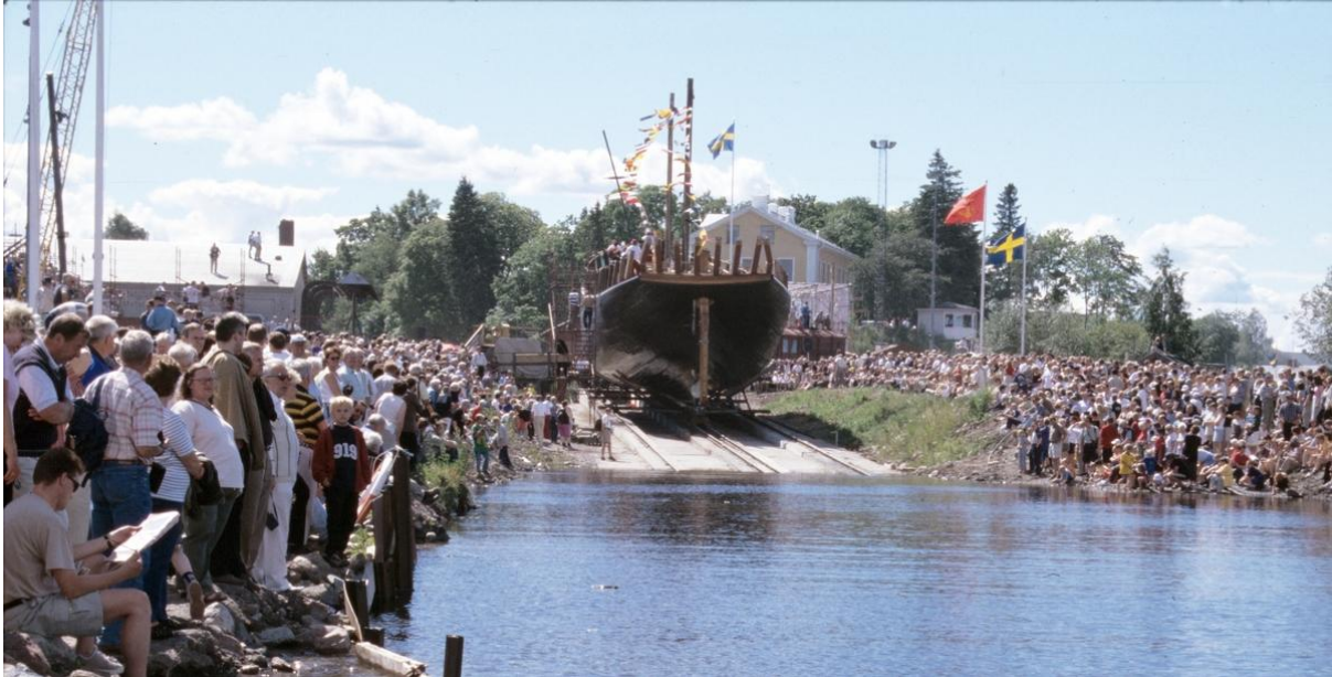
Gerda sjösättning 2000

Vid sjösättningen den 9 juli 2000 var det stor folkfest i Gävle för att bevittna den unika händelsen. Det var musik och fyrverkeri och uppslutningen av såväl stadens invånare som tillresta var enorm.