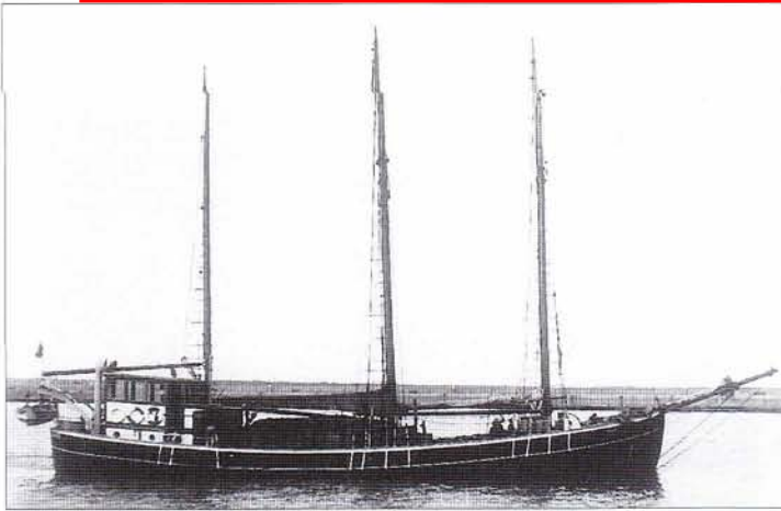
Ella av Skövde.