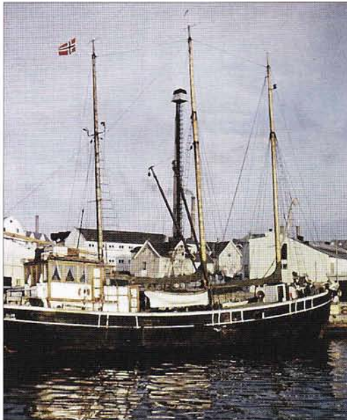
Ellan av Farsund i Stavanger ca 1958. Foto av tyskan Freia Hutzschenreuter som var mönstrad i Ellan 1958–1960. Freia har tagit samliga foton om inget annat anges.