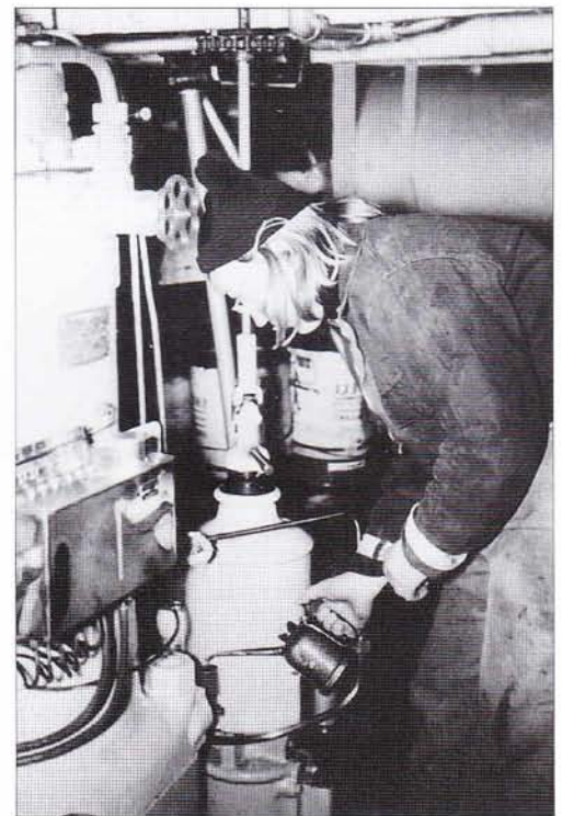
Skutans 2-cylindriga 120 hk Skandia motor smörjs av Freia.