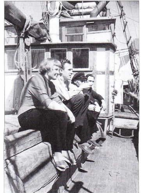
Manskapet på aktra luckan.