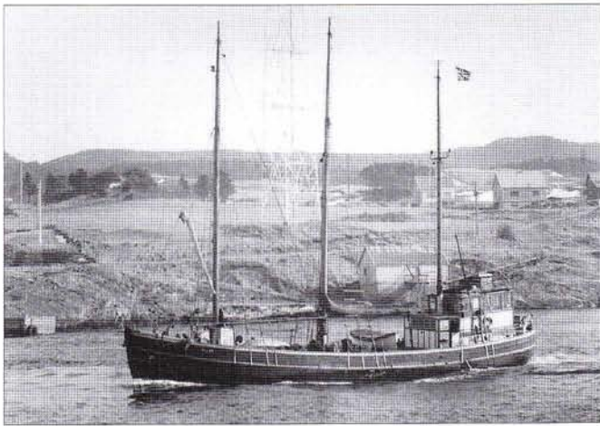
Ellan av Farsund i Karmsundet ca 1957. Med denna rigg seglade skoner- ten med till 1963. Då blev hon nedriggad till motorfartyg.