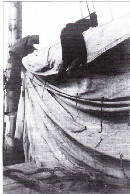
Här packar man seglen efter en seglats.