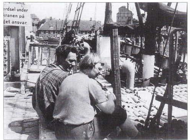
Ellan lastar cementrör i danska Horsens för Bergen i Norge.

Åren gick och restaureringen dröjde men till slut beslutades att den skulle ske på varv i Gilleleje i Danmark. Under bogsering dit den 25 september 2001 sjönk den gamla skutan och blev en totalförlust.