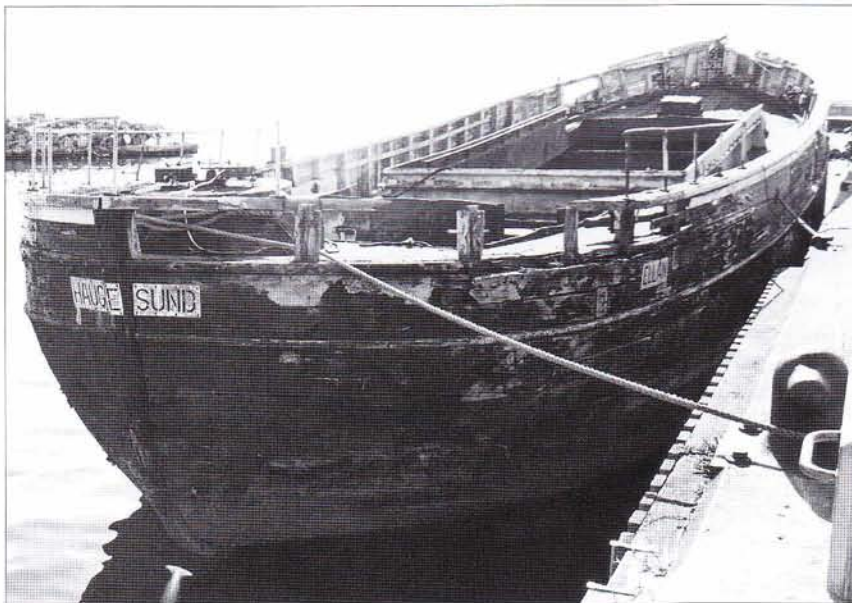
Ellan i Råå hösten 1996.

Åren gick och restaureringen dröjde men till slut beslutades att den skulle ske på varv i Gilleleje i Danmark. Under bogsering dit den 25 september 2001 sjönk den gamla skutan och blev en totalförlust.