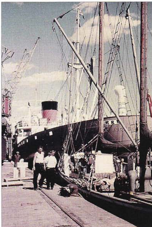
Ellan och brittiska Rochester Castle i Oslo.